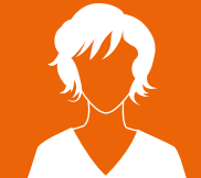
Roline de Wilde CBF