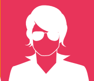
Kellie Liket Impact Centre Erasmus

Delen en leren van best practices, tonen van kwetsbaarheid en meer aandacht voor de toekomst