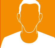
Tom Oostrom Nierstichting